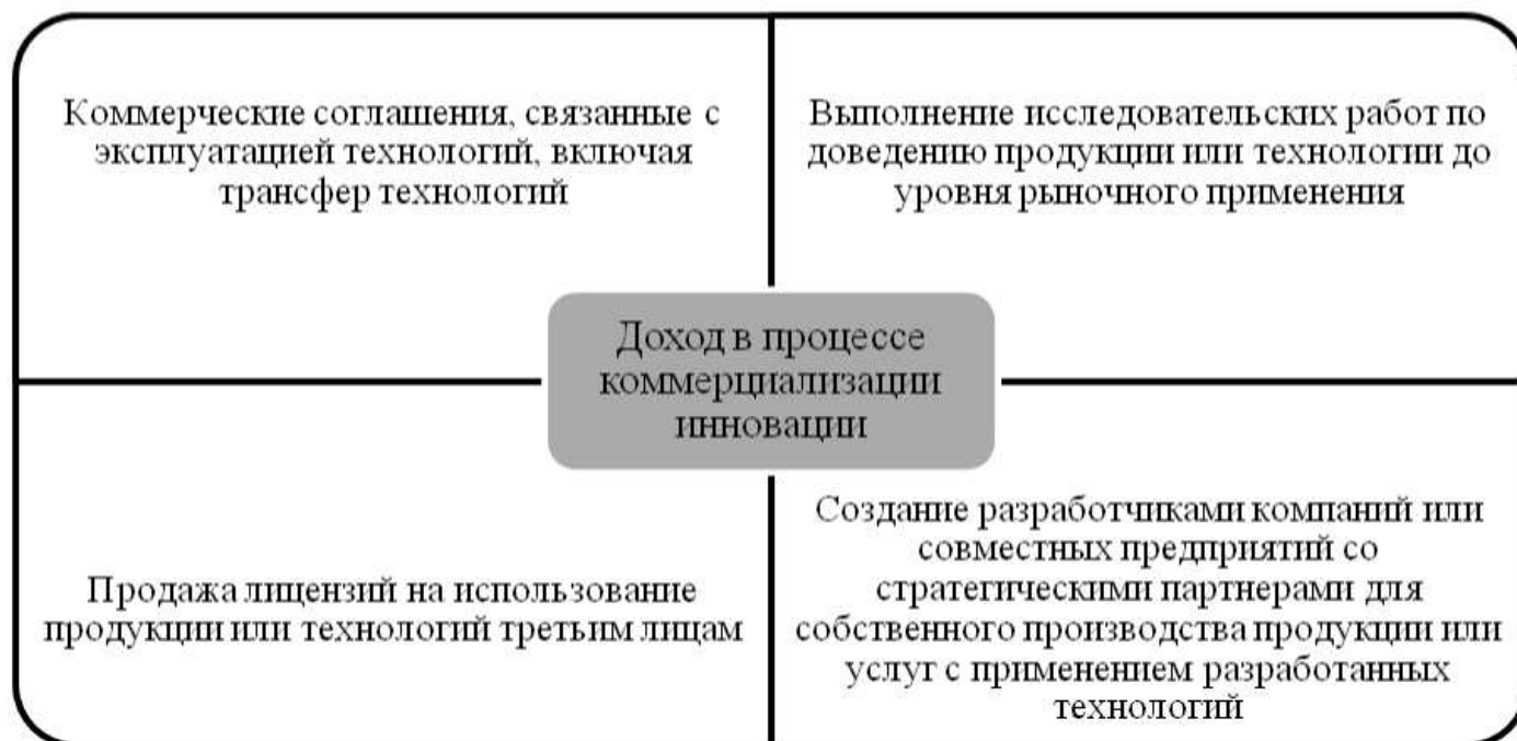
Рисунок 3. Основные источники дохода в процессе коммерциализации инновации

Коммерциализация является процессом выведения результатов инновационного проекта на рынок и состоит из нескольких этапов: