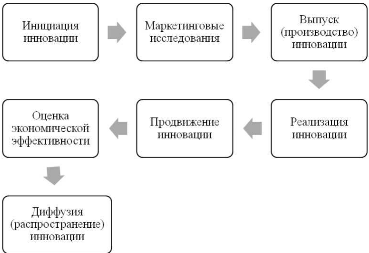
Рисунок 1. Структура инновационного процесса

Так, начальным этапом инновационного процесса является инициация. Инициация - это деятельность, состоящая в выборе цели инновации, постановке задачи, выполняемой инновацией, поиске идеи инновации, её технико-экономическом обосновании и в материализации идеи. Материализация идеи означает превращение идеи в товар (имущество, новый продукт и т.д.).